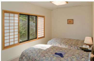
和洋室1室 (10畳とツインベット)